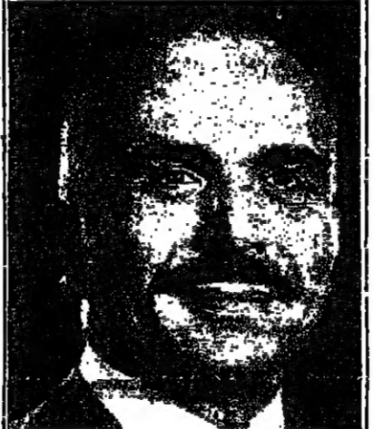
البعث . واضاف الملك الاردني ان هذا اتجاه جديد لم تعرفه الامة العربية من قبل . وحذر من

واضاف الملك حسين ان من لا يريد مساعدة اخيه فليكني بالدماء له ، اما ان يتقل بكل قسوة الى مساعدة اعدائه ، فذلك من شأنه تصعيد الحد الأدنى من التجميد بين الدول العربية بل والنزول بالشرخ الى بنينة شعوب هذه الدول وحقنها بالحدق ضد بعضها البعض .